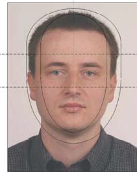
Příklad fotografie / Example photograph